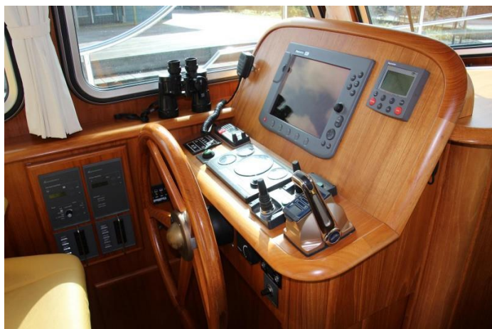
Autopilot en snelheidsmeter vernieuwd 2018