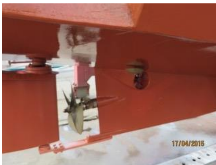
Antifouling nieuw aanbracht 2020