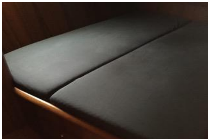
Nieuwe matrassen 2015