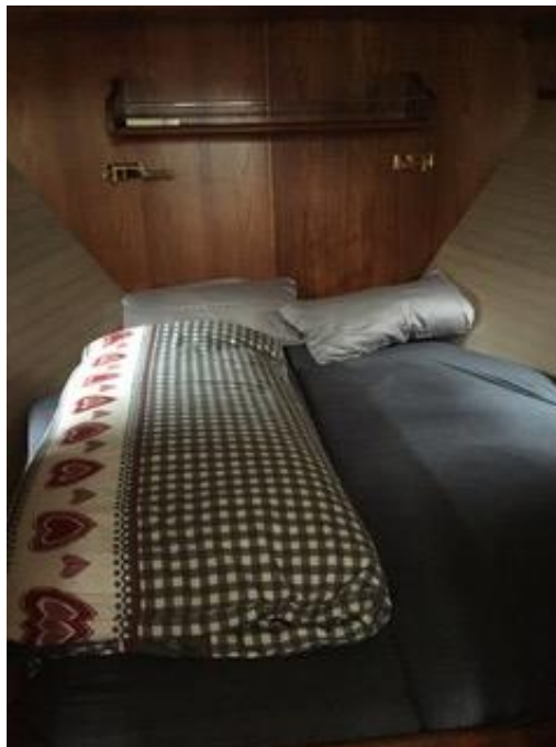
Nieuwe matrassen 2015