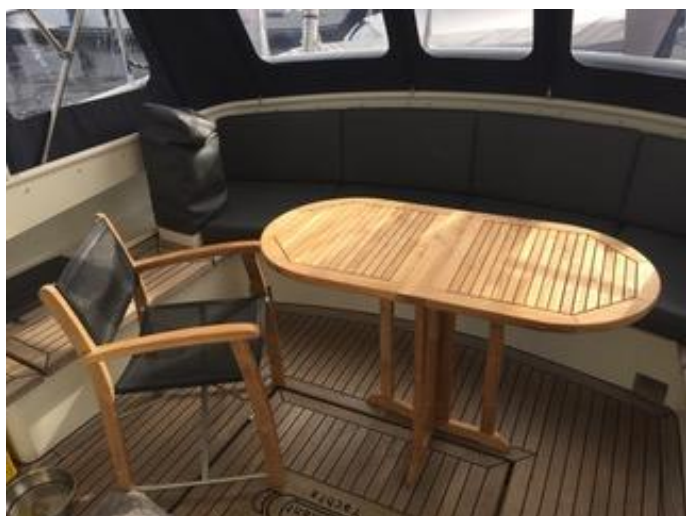
Kunstleder bekleding 2015