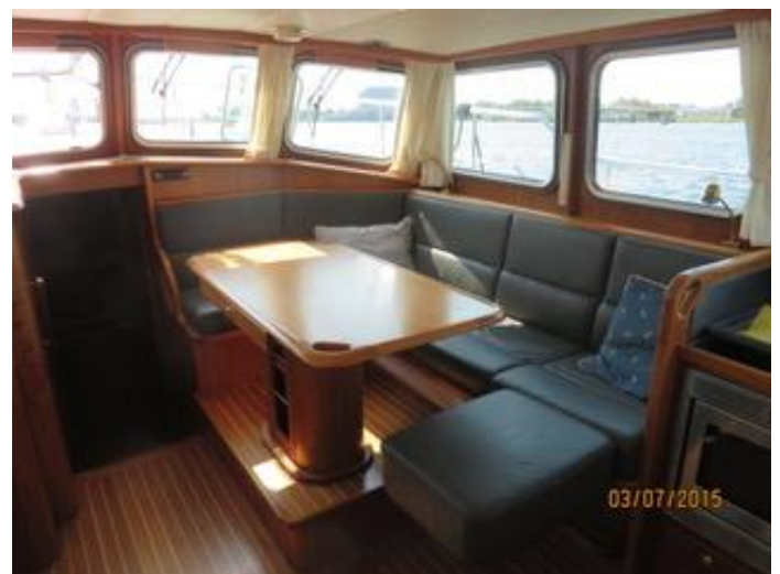
Leder bekleding 2015