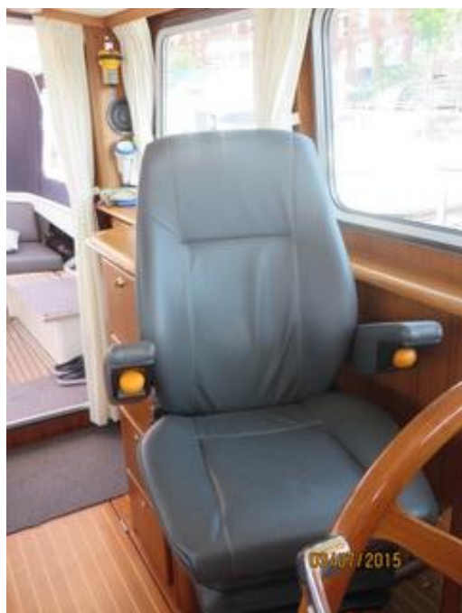
Leder bekleding 2015